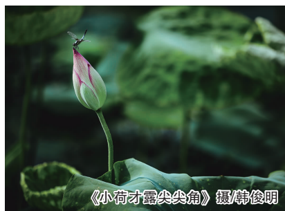
《小荷才露尖尖角》