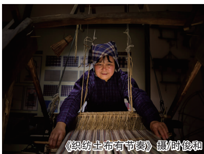
《织纺土布有节奏》