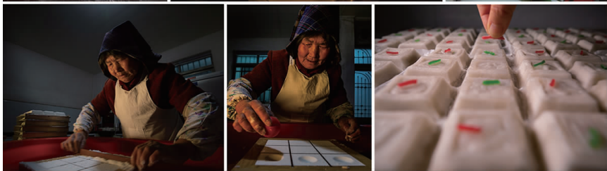
《九宫格里传非遗》