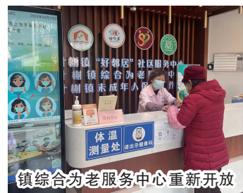
镇综合为老服务中心重新开放